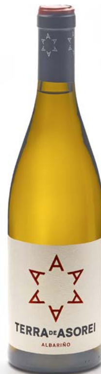
Pepe Barro: Terra de Asorei , 2018. Galicia. Terra de Asorei

Pero nun panorama aínda atomizado, requírense sempre máis impulsos para conseguir impactar no mercado e facer fortes as oportunidades. Por iso esperamos que esta exposición —que é unha acoutada selección de propostas dun amplo e excelente quefacer por toda a nosa xeografía— achegue o bo deseño ao gran público e colabore a situar e prestixiar, aínda máis, o papel