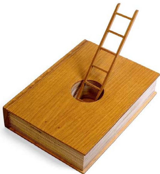
Estudio Pep Carrió: Biblioteca Palermo. Libro-escalera , 2020. Comunidad de Madrid. Con la colaboración de Francisco Martín, maestro tornero.

COMPLICIDADES. Poderíamos dicir que este eixe é transversal a toda a exposición porque o momento actual obríganos a debuxar o mundo contando co benestar das persoas, asumindo desafíos de maneira moito máis responsable. A modo de exemplo, destacamos as intervencións de Arauna Studio / Rai Pinto, deseñadas para mellorar a experiencia dos nenos nos hospitais, ou unhas lentes que converten o espazo 3D circundante en sons intuitivos, concibidas por Alegre Design e pensadas para ofrecer a mellor experiencia de usuario.