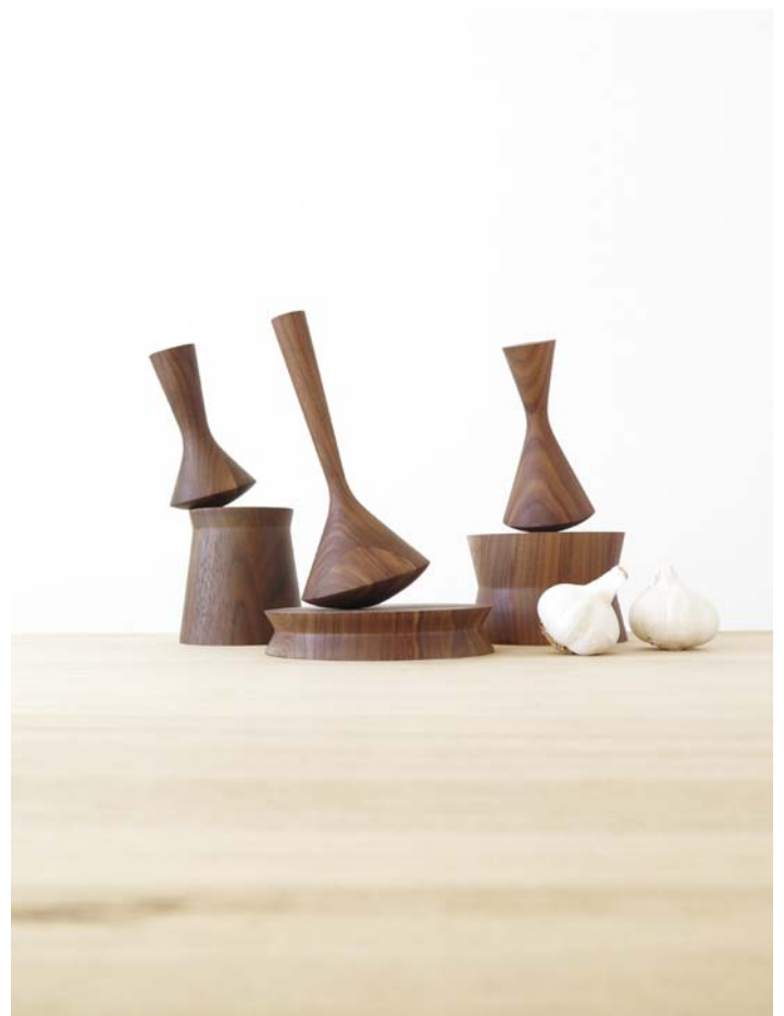
Martín Azúa: TÓTEM , 2019. Catalonia. Mobles 114

COMPLICITIES. We could say that this theme transverses the whole exhibition because the current moment forces us to paint the world taking into account people's wellbeing whilst facing challenges