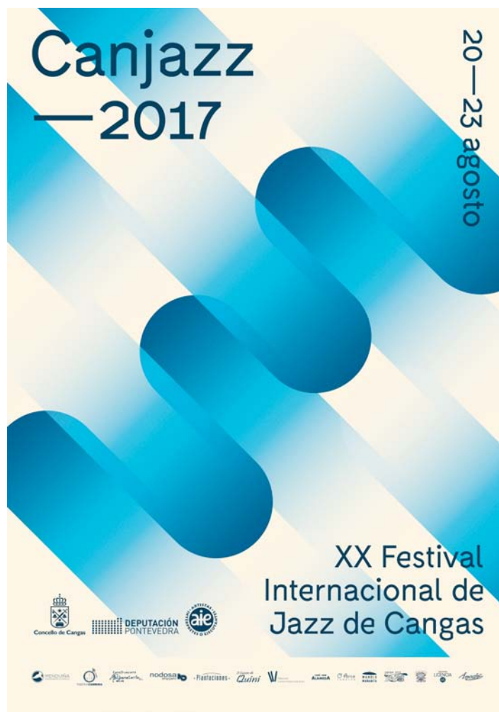
Guillotina Studio: Canjazz , 2017. Galicia. Concello de Cangas

hospitales, o unas gafas que convierten el espacio 3D circundante en sonidos intuitivos, firmadas por Alegre Design y pensadas para ofrecer la mejor experiencia de usuario.