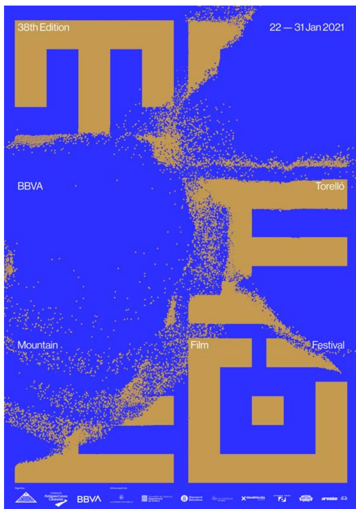
Ingrid Picanyol: Torelló Mountain , 2020. Cataluña. Fundació Festival de Cinema de Muntanya de Torelló