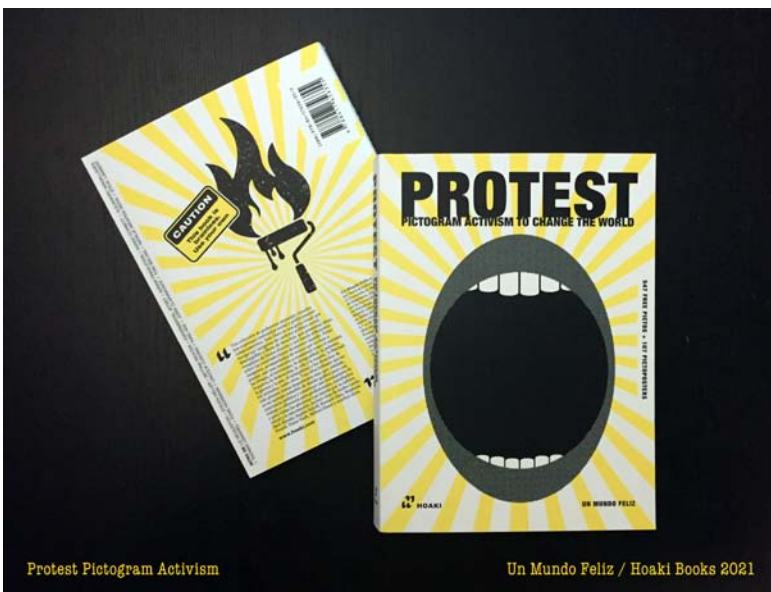
Un Mundo Feliz (Sonia Díaz, Gabriel Martínez): Protest , 2021. Region of Madrid. Hoaki Books